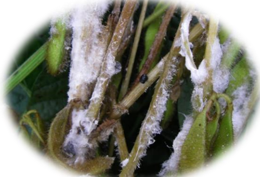
Mofo branco - Sclerotinia sclerotiorum