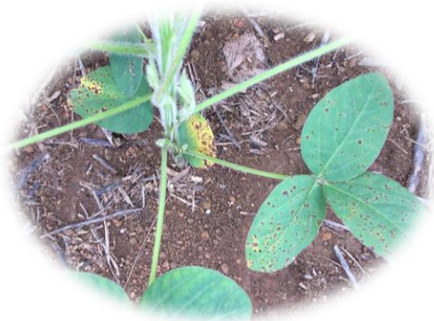
DFC's - Septoria glycines e Cercospora kikuchii

Além da Ferrugem Asiática, o produtor rural deve também estar atento à ocorrência de outras doenças: