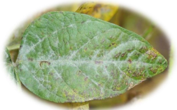
Oídio - Microsphaera diffusa